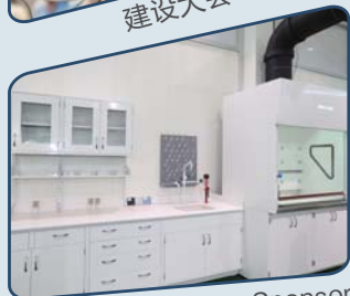
家具展示 Furniture Sponsor