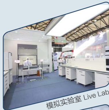
模拟实验室 Live Lab