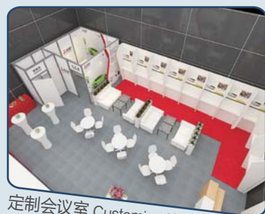
定制会议室 Customized Meeting Room