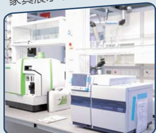
设备展示 Equipment Sponsor