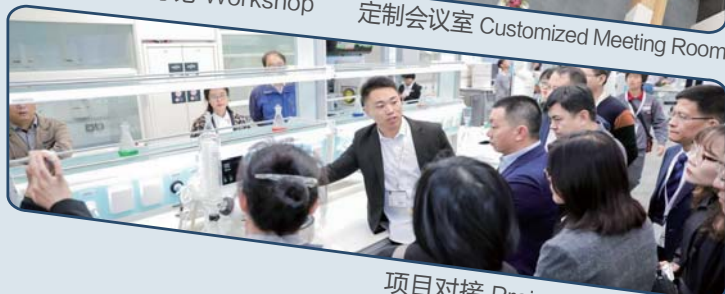
项目对接 Project Match-Making