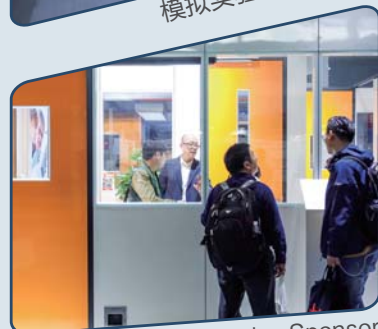
配套展示 Accessories Sponsor